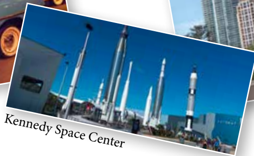
Kennedy Space Center