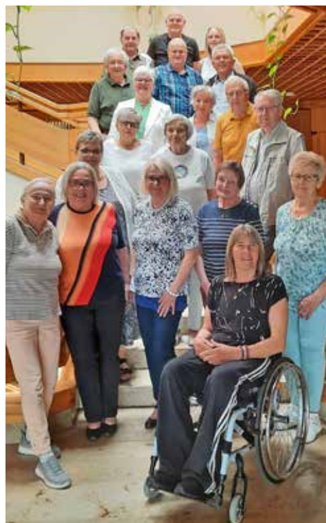
Beitrag und Foto: Margit Kirnbauer

In Planung ist zudem eine weitere Stoma-SHG-Bgld in Oberpullendorf. Sobald die Lokalität dafür finalisiert ist, erfolgt der Start mit einem Gruppentreffen.