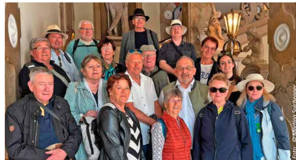
Gruppenfoto im Schloss Mirabell

burg, zum Großen Festspielhaus. Nachdem nun die Mittagszeit schon stark überschritten war, gingen wir relativ flott über den Grünmarkt ins Sternbräu, wo schon Tische für das Essen reserviert waren. Bei herrlichen Wetter konnten wir im Gastgarten Platz nehmen. Bei Speis und Trank und einen regen Austausch ging ein netter Tag in Salzburg zu Ende, unsere Freunde haben es offensichtlich auch genossen. Mit der gegenseitigen Versicherung, unsere Treffen zu wiederholen, ging ein sehr netter Tag zu Ende.