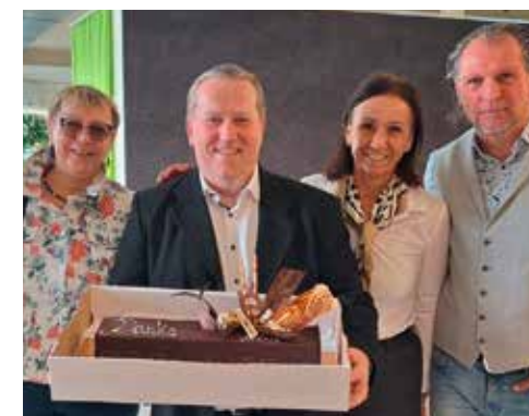
Beitrag und Fotos: Regina Herzog