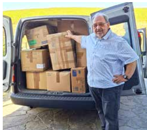
Beitrag: Hans-Rainer Offenhuber

und unsere Versorgung sehr dankbar sein. Bei uns wird oftmals bereits Unzufriedenheit geäußert, wenn ein Hilfsmittel kurzfristig nicht lieferbar ist. Im Vergleich zu den Bedingungen in vielen anderen Ländern ist das jedoch tatsächlich „Jammern auf hohem Niveau“. Gerade solche Hilfsaktionen zeigen, wie wichtig Solidarität, Menschlichkeit und gegenseitige Unterstützung sind. Jede einzelne Spende kann dazu beitragen, die Lebensqualität von Betroffenen nachhaltig zu verbessern und ihnen ein Stück Sicherheit und Würde im Alltag zurückzugeben.